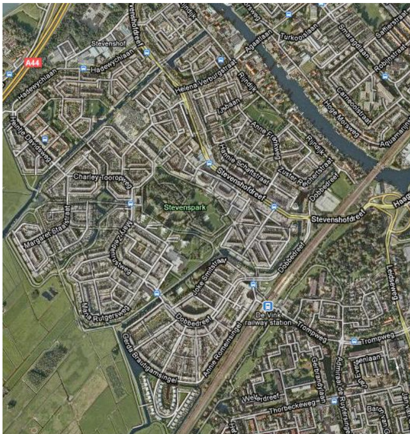
Figuur 1.1 Overzicht de Stevenshofdistrict, Leiden

In onderstaande figuur is het gebied rondom de Stevenshof weergegeven. De stad Leiden is opgebouwd uit 10 districten en 54 buurten. Het Stevenshofdistrict is onderverdeeld in vier buurten: Schenkwijk, Kloosterhof, Dobbewijk-Noord en Dobbewijk-Zuid.