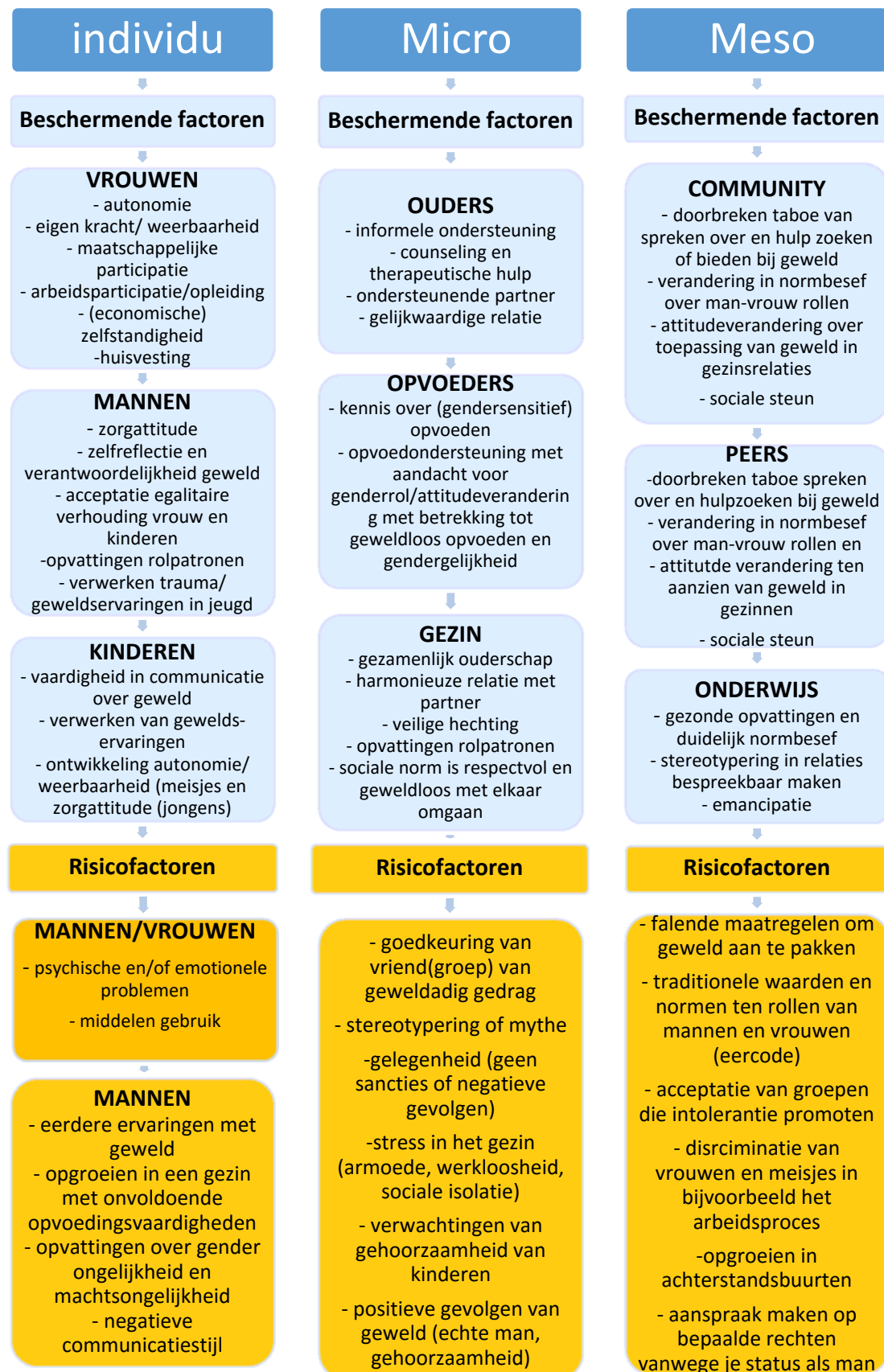
Schema 2: Beschermende factoren en risico factoren ten aanzien van het voorkomen en doorbreken van huiselijk geweld vanuit het perspectief van gezinnen. 4