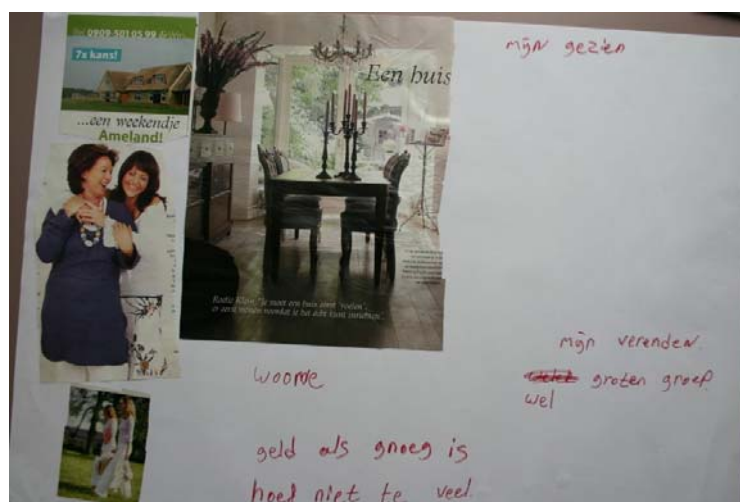
Toekomstbeelden uit groeps gesprekken

'De ene groep heeft het weliswaar financieel heel zwaar, maar de woning ziet er nog keurig onderhouden uit. Hier is de armoede verborgen- mensen zien er netjes uit, maar komen van heel weinig rond. Bij de andere groep is het een puinhoop en treedt overlast op. Dan gaat de financiële problematiek samen met andere problemen, zoals bijvoorbeeld verslaving.'