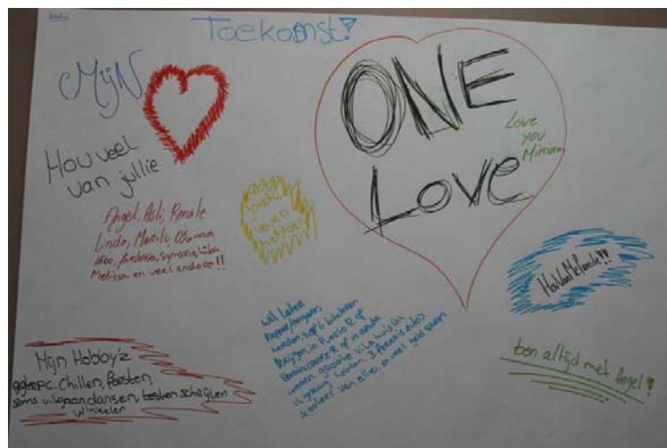
Toekomstbeelden uit groepsgesprekken

In dit hoofdstuk gaan we dieper in op de diverse gezichten van armoede in Amersfoort. Wat verstaan medewerkers van intermediaire organisaties in Amersfoort onder armoede? Hoe definiëren zij armoede? Hoe ontstaat armoede? Hoe leven mensen met een minimuminkomen?