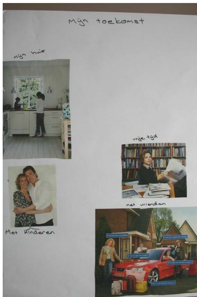
Toekomstbeelden uit groepsgesprekken

'In Nederland ben je bijna gedwongen om schulden te hebben; door ons systeem van studiebeurzen, hypotheek, auto's op afbetaling. Sparen wordt niet beloond; over je spaargeld betaal je belasting; een extra stimulans om je leningen (hypotheek bv. hoger te maken).'