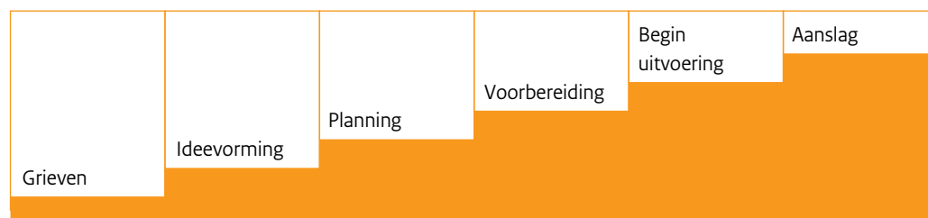
Figuur 1. 'Path to intended violence' (Calhoun & Weston, 2003; uit IPOL, 2007)

Zij komen tot de conclusie dat personen die een aanslag plegen, dus daadwerkelijk tot handelen overgaan, voorafgaand aan het geweld een aantal stadia doorlopen. Zij beschrijven de stadia van gepland naar feitelijk geweld en onderscheiden daarin zes stappen (figuur 1):