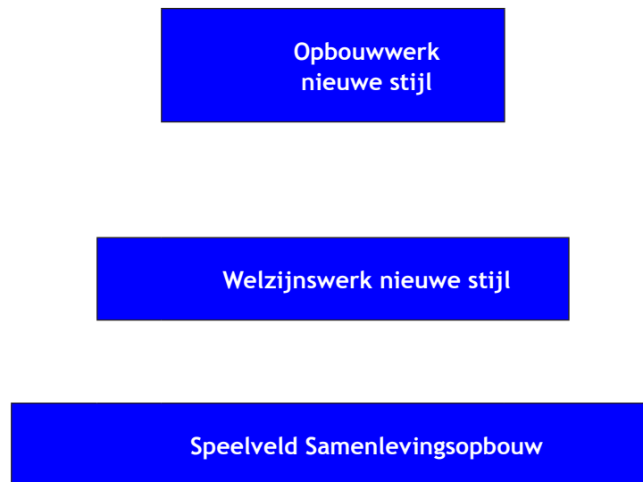
Schema 1 Samenlevingsopbouw in relatie tot welzijnswerk en opbouwwerk